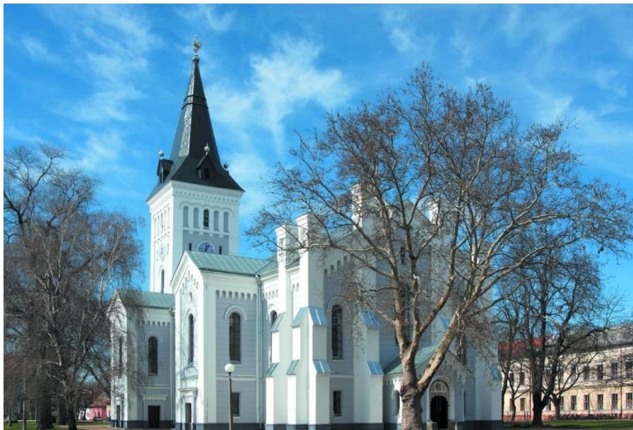
5. Hajdúböszörményi Bocskai téri Református templom