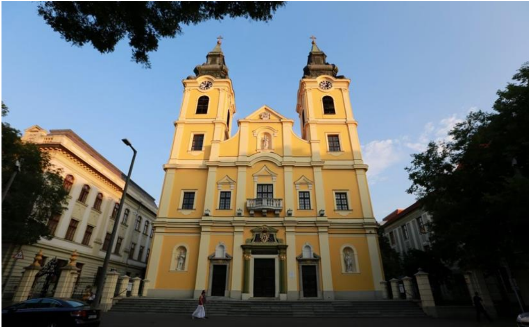
1. Debrecen - Szent Anna-székesegyház