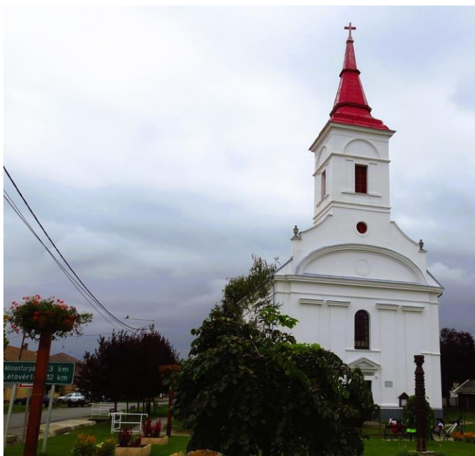
6. Hosszúpályi - Szeplőtelen fogantatás római katolikus templom