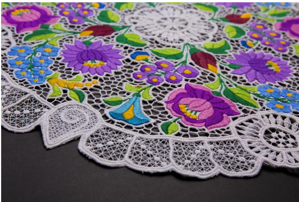
6. Kalocsai népművészet: írás, hímzés, pingálás - Kulturális örökség