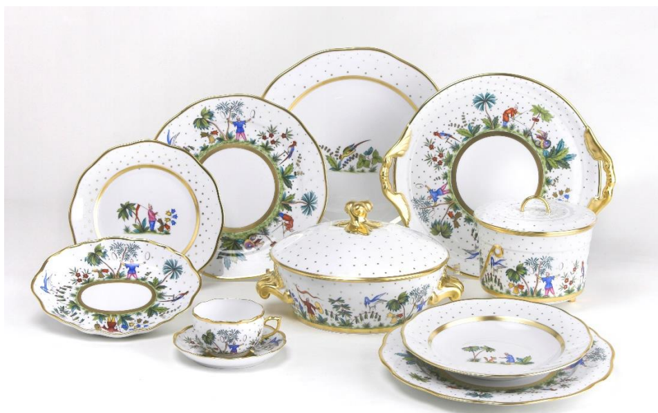
4. Herendi porcelán - Kulturális örökség