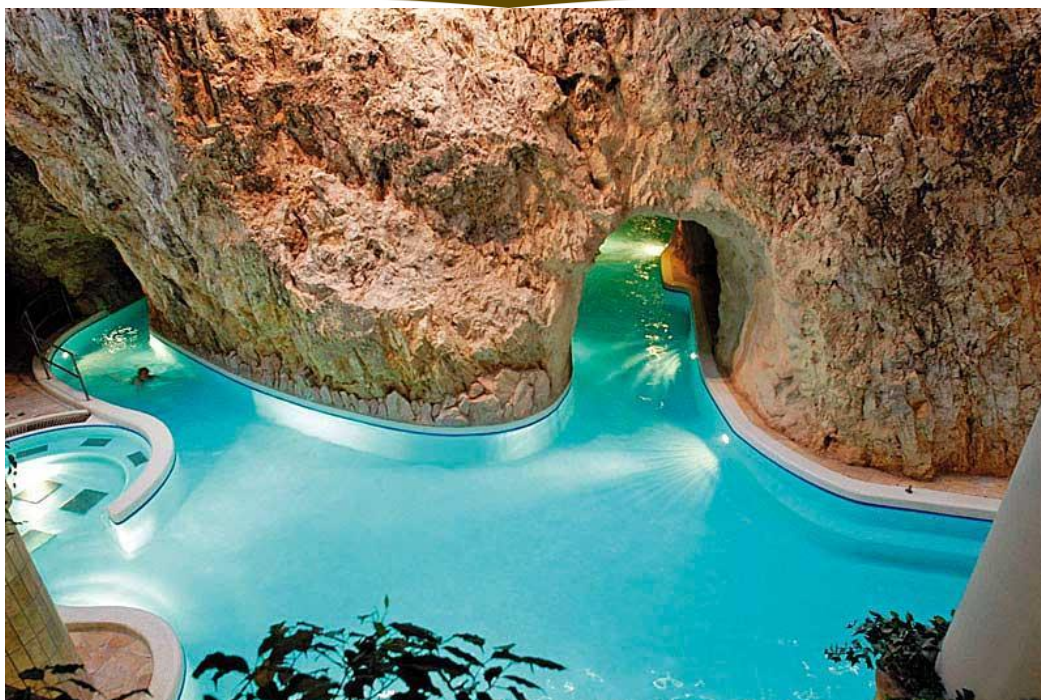
5. Miskolctapolcai Barlangfürdő - Turizmus és Vendéglátás