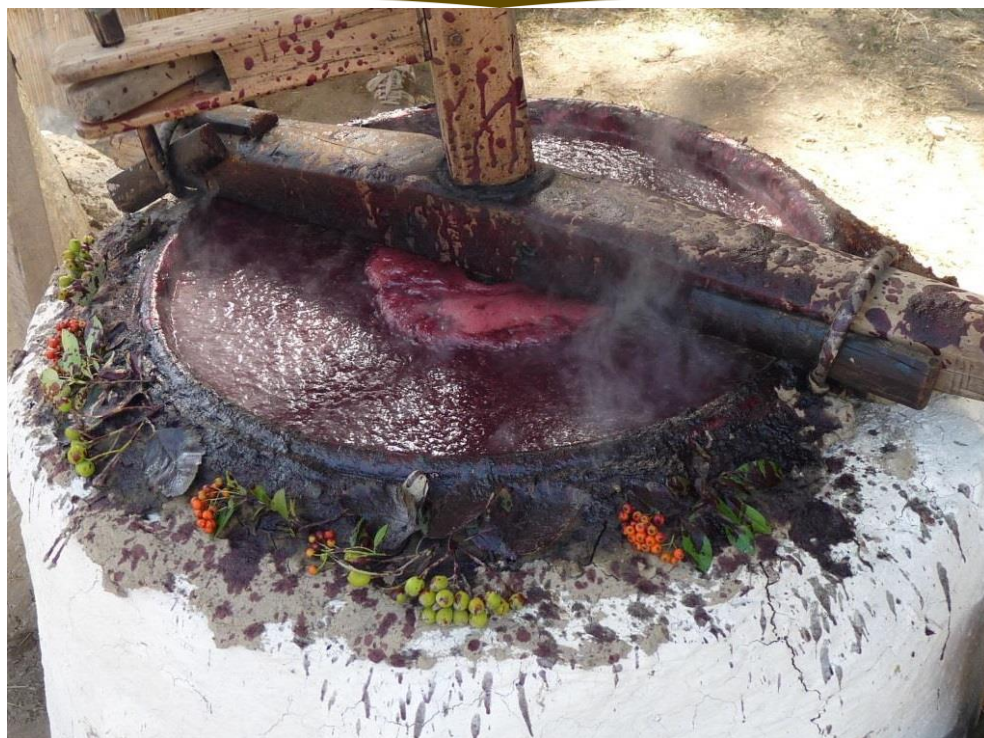
3. Szatmári szilvalekvár - Agrár- és élelmiszergazdaság