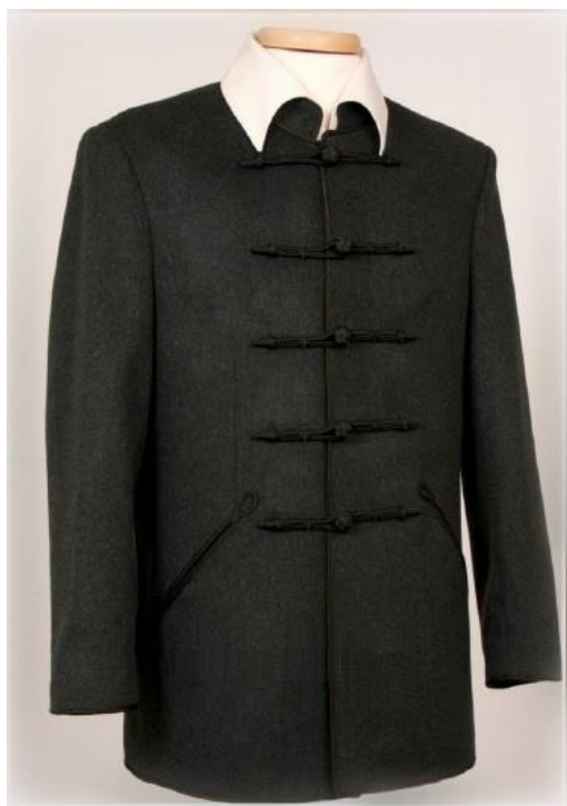
4. Bocskai viselet - Kulturális örökség