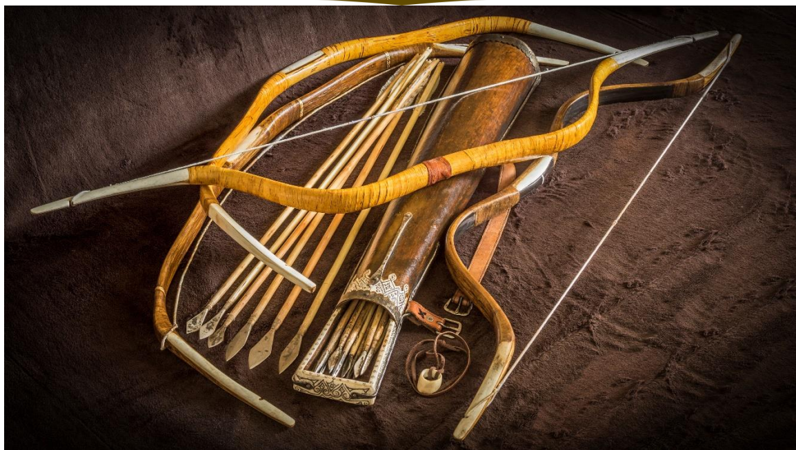
3. IX-XI. századi magyar íj - Kulturális örökség