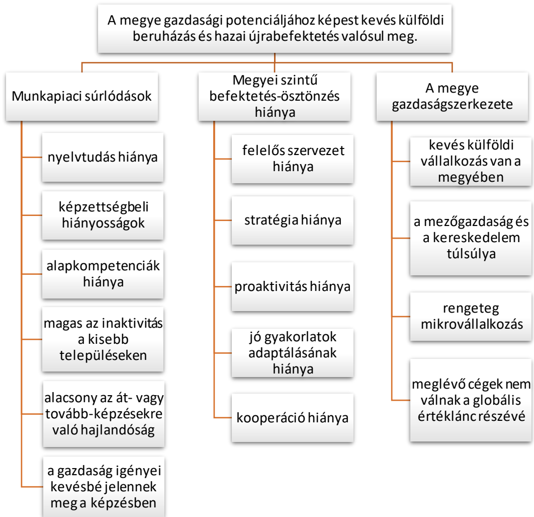
1. ábra: Hajdú-Bihar megye befektetés-ösztönzési problémafája