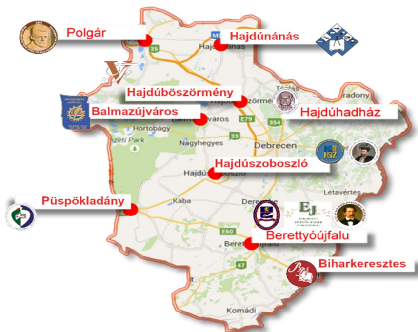
1. sz. ábra

A 1. számú ábrán bemutatom, hogy a tagintézmények a vármegye egész területét érintve hogyan helyezkednek el.